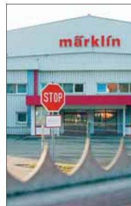
Das Sonneberger Werk des Modellbahnherstellers Märklin.

Schon als das stark angeschlagene Traditionsunternehmen im Mai 2006 vom britischen Finanzinvestor Kingsbridge Capital übernommen wurde,